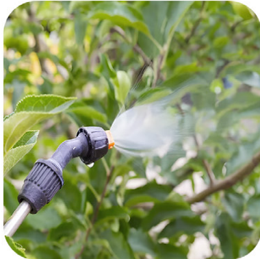
penyemprotan obat hama penyakit