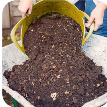
topping up media tanam